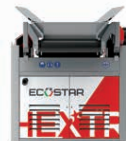
Hextra modello scarrabile