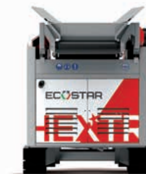
Hextra modello cingolato